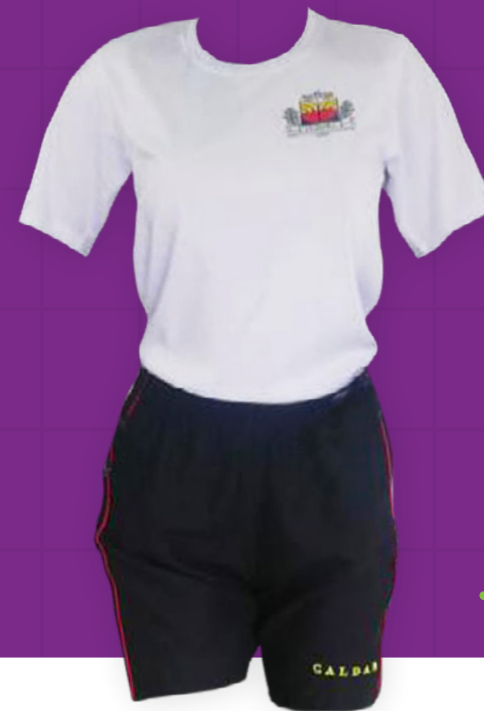
Camiseta y pantaloneta.