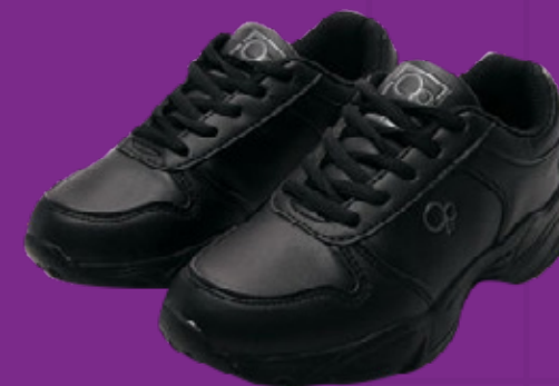
Tenis con cordones y totalmente negros. Medias negras a mitad de pierna.