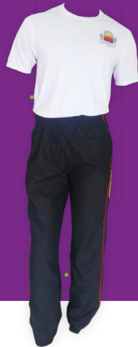
Camiseta y sudadera.